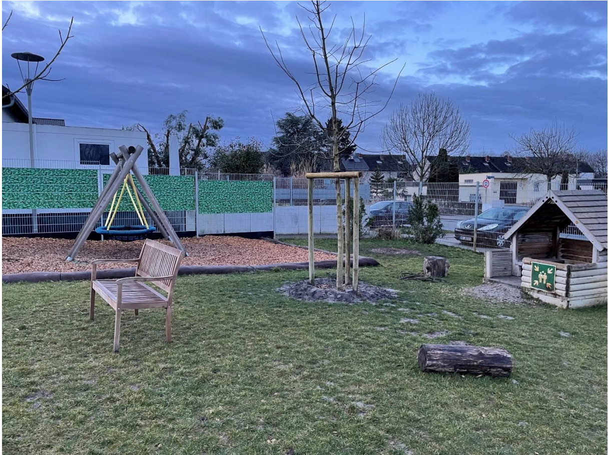
Außengelände: Kita-Wirbelwind, Neuhofen