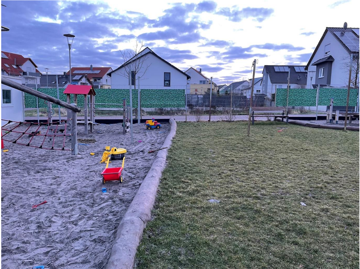
Außengelände: Kita-Wirbelwind, Neuhofen